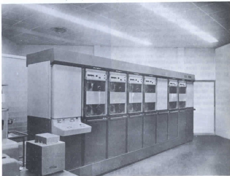
Ensemble de moyenne importance, souple, rapide, extensible spécialement conçu pour les problèmes de gestion

de conception française adapté aux besoins européens